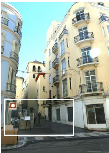
Calle Andrés Pérez