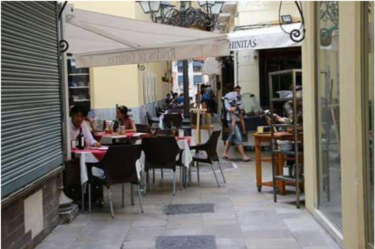
Pasaje de Chinitas