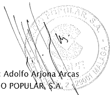
Fdo.: Adolfo Arjona Arcas RADIO POPULAR, S.A.