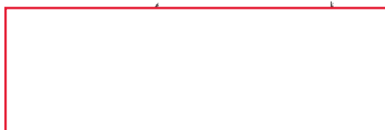
D. Francisco de la Torre Prados Alcalde de Málaga

Este convenio ha sido efectivamente firmado