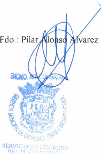
Fdo.: Pilar Alonso Alvarez