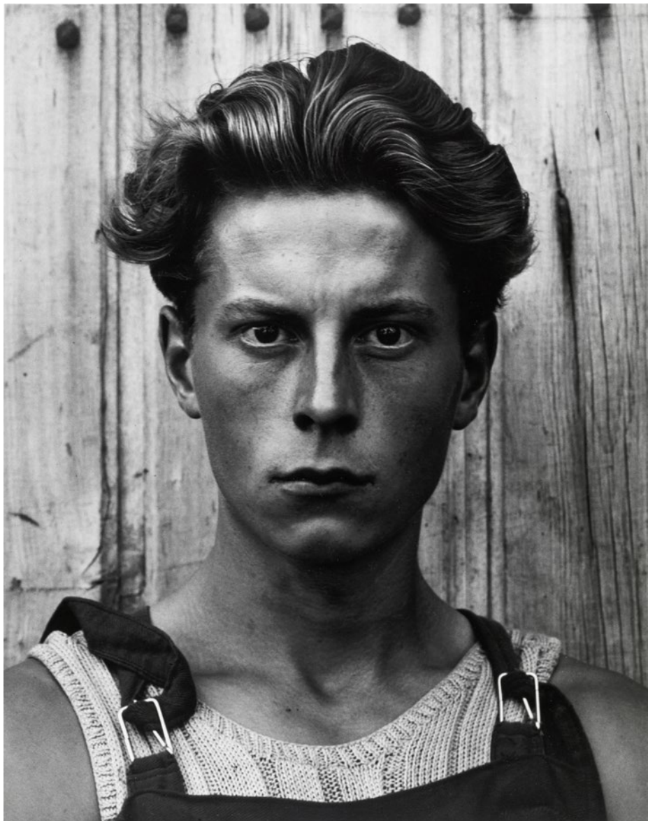
Muchacho, Gondeville, Charente, Francia