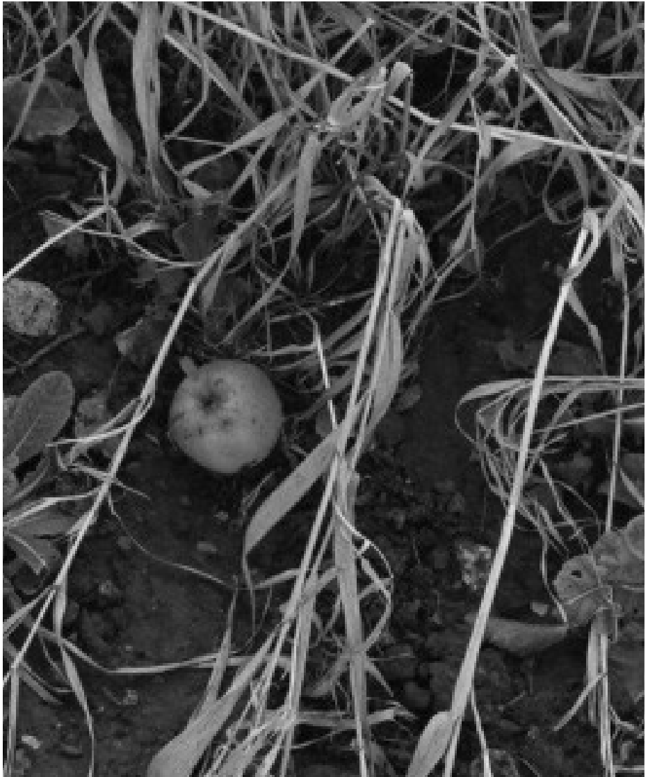
Manzana caída, El Jardín, Orgeval, Francia Fallen Apple, The Garden, Orgeval, France 1972