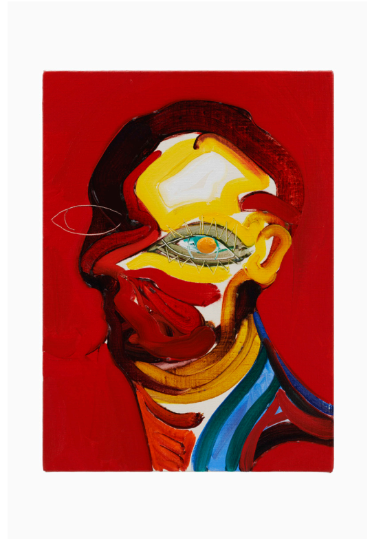
FINAL DE HOY- 17/1/2022. CABEZA