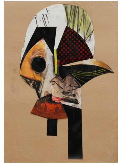
ESTUDIO PARA LA MÁSCARA