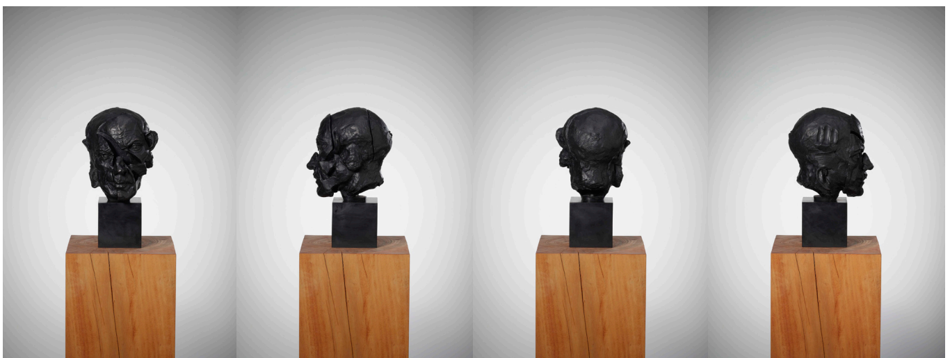
Yukimasa Ida. A head of Picasso 2021–2022. 40,5x19,5x23,5 cm. Bronze. © IDA Studio Inc.

Rostro(s) que regresan una vez más –como una especie de pirueta plástica de eterno retorno– al imaginario de este proyecto, de nuevo inscritos en el Reino 3D de la escultura. El rostro de Picasso formalizado en bronce pintado de blanco y al mismo tiempo convertido ahora en construcción –deconstrucción del inconfundible volumen de su cabeza.