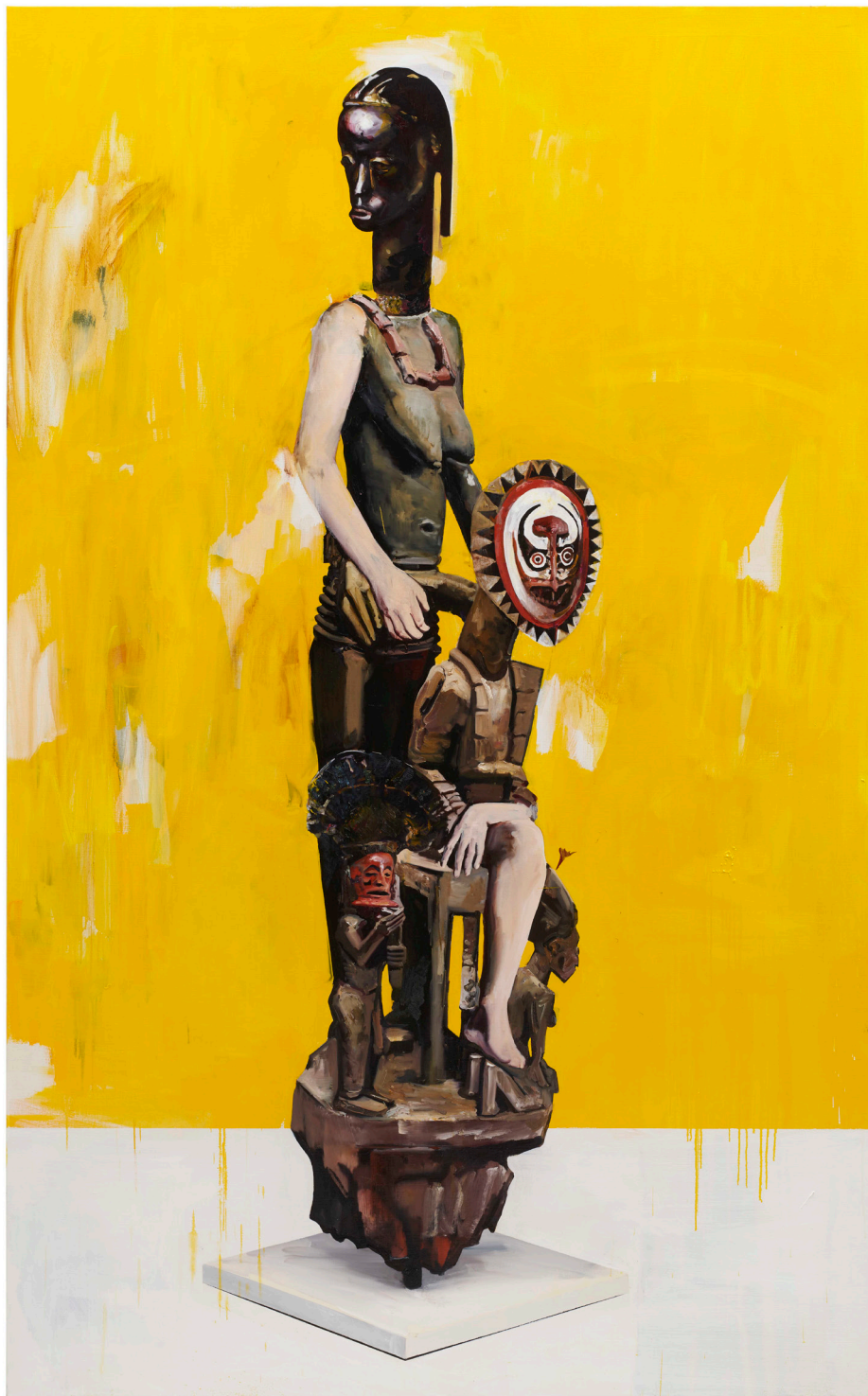
Yukimasa Ida: Estatua sin título 2022. Óleo sobre lienzo, 259 x 162 cm. © IDA Studio Inc.