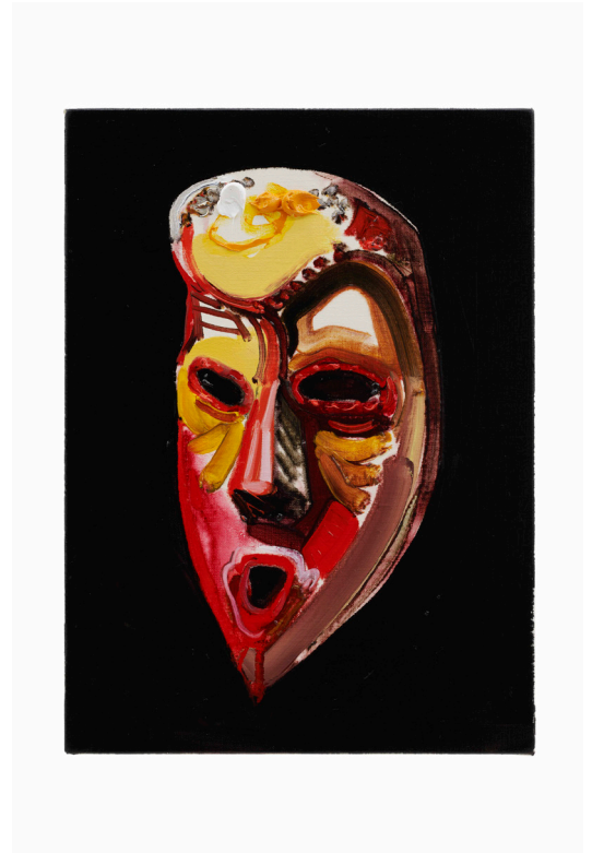
FINAL DE HOY– 16/1/2022 MÁSCARA AFRICANA