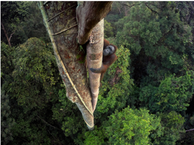
Kalimantan, Borneo, Indonesia.

A 30 metros del suelo, este orangután de Borneo trepa en busca de unos preciados higos. Los orangutanes crean un mapa mental de la selva, y recuerdan cuándo y dónde encontrar fruta madura. Indonesia pierde cada año miles de hectáreas de sus bosques tropicales debido a la tala y a las plantaciones de palma aceitera, lo que pone en peligro la supervivencia de estos animales.