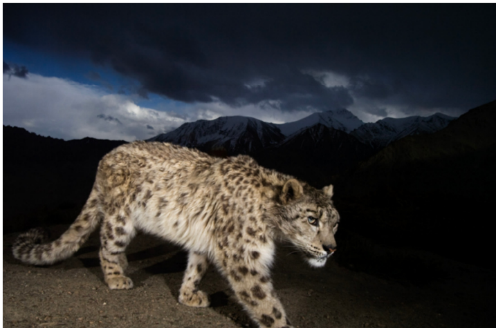
Parque Nacional de Hemis, Ladakh, India.

El fotógrafo Steve Winter necesitó 13 meses, mucha pericia y algo de suerte para lograr inmortalizar al esquivo leopardo de las nieves gracias al uso de cámaras trampa. Una foto de esta serie ganó en 2008 el primer premio del prestigioso certamen Wildlife Photographer of the Year .