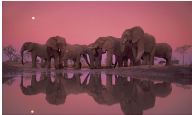
Parque Nacional de Chobe, Botsuana.

edición de 2018 del Wildlife Photographer of the Year en reconocimiento a su trayectoria, de más de tres décadas, y fue precisamente con esta imagen con la que se anunciaba el premio.