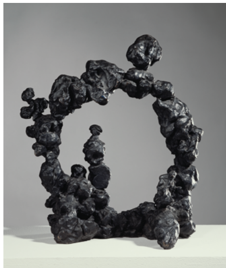
Scultura spaziale [Escultura espacial] (47 SC 1), 1947 Bronce, 56,5 × 50,5 × 24,5 cm

Lucio Fontana nació en Argentina y sus padres lo enviaron a estudiar a Italia. Se alistó en el ejército italiano durante la Primera Guerra Mundial, llegó a ser oficial y fue herido en el frente. En 1921, regresó a Argentina y se dedicó a la escultura, inicialmente en el taller funerario de su padre. A continuación, realizó varios encargos públicos a título personal, antes de regresar a Italia para completar su formación en la Academia de Brera, en la clase de Adolfo Wildt. Su producción académica se vio marcada por el neoclasicismo del maestro y durante un tiempo brilló entre la élite del arte oficial. El Uomo nero [Hombre negro] (1930), una obra destruida, supuso un giro postcubista en su trabajo, que lo llevó hacia la abstracción geométrica. En 1935, participó en la primera exposición de escultura abstracta en Italia, en la galería Il Milione de Milán.