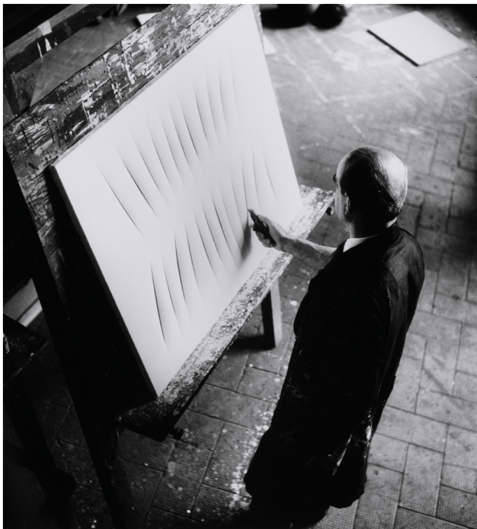
Lucio Fontana travaillant dans son atelier, Paris [Lucio Fontana trabajando en su estudio, París] [ca. 1958-1973]