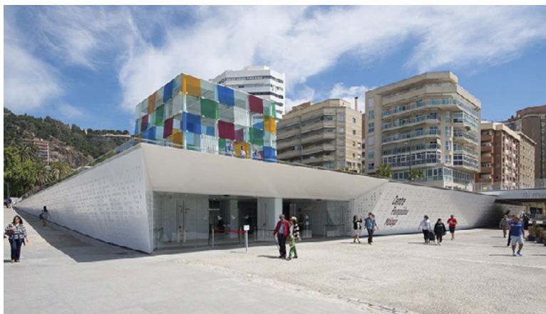
Centre Pompidou Málaga

Comprometidos en la renovación de esta colaboración, los equipos trabajan en las futuras programaciones del Centre Pompidou Málaga: en torno a un recorrido del arte de los siglos XX y XXI (concebido con las obras maestras de la colección del Centre Pompidou), se propondrán cada año exposiciones temporales, espectáculos de danza, performances, conciertos, cine, conferencias, talleres y programas de mediación, para todos los públicos, y en contacto directo con la escena artística local y española.